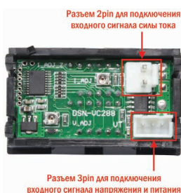
Рис. 2 – Вид сзади