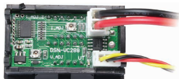
Рис. 3 – Вид сзади с подключенными входными сигналами